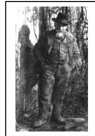
( Chansons de Margot )