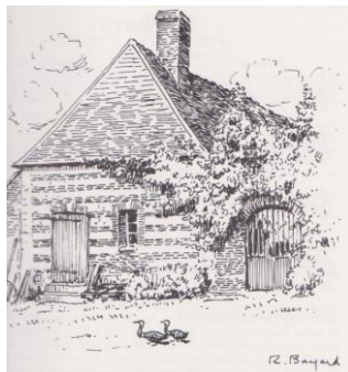
Maison de l'auteur